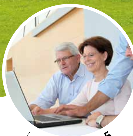
Infos pratiques p.5