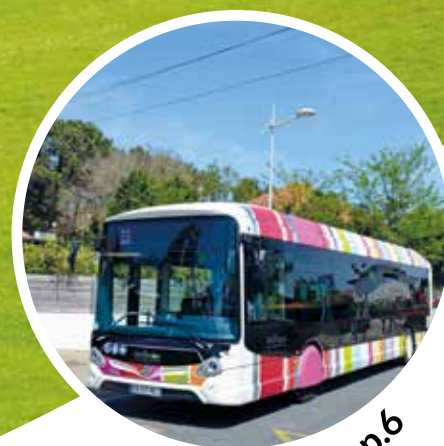
Vie quotidienne p.6