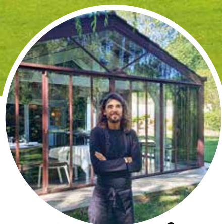
Temps Libre p.3